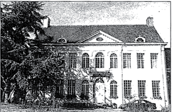
Een 18de-eeuws buitenhuis, later kloosterpand, werd in enkele maanden tijd omgebouwd tot een fictief woon- en zorgcentrum waar opmerkelijke inleefstages georganiseerd worden.